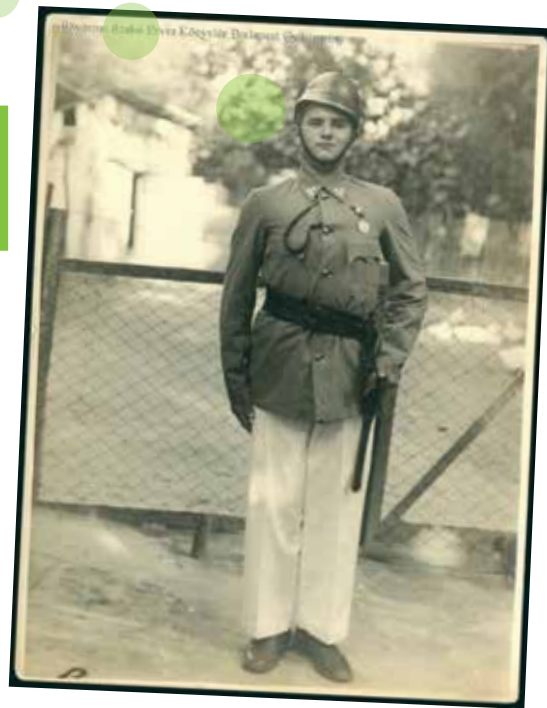
Önkéntes tűzoltó az 1920-as években

Széchenyi Ödön maga is megtapasztalta, milyen pusztításra képesek a lángok, amikor 1860 szeptemberében tűzesetek voltak Nagycenken és Fertőszentmiklóson. Látta az emberek szenvedését, a tehetetlenséget és a szervezetlenséget. Így amikor Londonban járt, kihasználta az alkalmat, hogy megismerje az akkor már világhírű helyi tűzoltó csapatot, és ott gyakorlatot szerezzen. Az angol tűzoltókapitány meglepődéssel fogadta a kezdeményezést, de engedélyezte a belépést. Viszont egyáltalán nem kímélte a gróft: Széchenyinek minden munkából